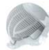
machinaal + monofilament