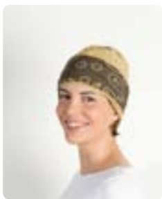
Buff om 's nachts te dragen.