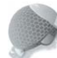
handgeknoopt + monofilament